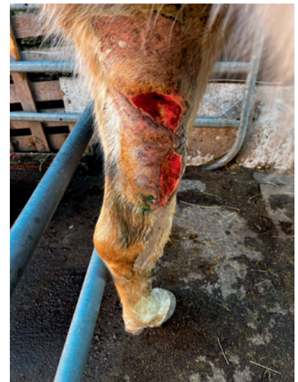
Abb. 3: Wundzustand am 07.02.2023