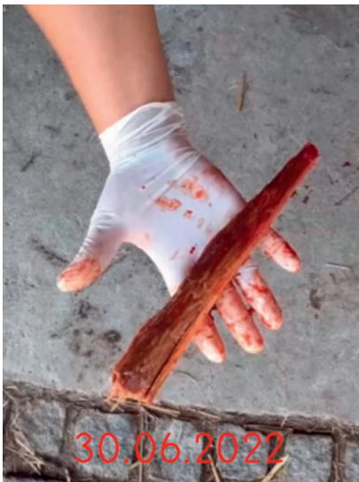
Abb. 1: 30.06.2022 Die Abbildung zeigt einen der herausoperierten Holzsplitter

Die Wunde hatte eine Gesamtlänge von 17 cm, im oberen Bereich eine Breite von 7 cm, im unteren Bereich eine Breite von 4 cm. Sehr tiefe Wunde, der Knochen war zu sehen. Ruby kam ohne Verband ins HorseAirium, nur mit Braunol und Blauspray auf der Wunde.