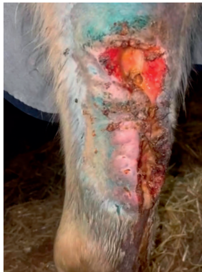
Abb. 2: Wundzustand bei Aufnahme ins HorseAirium am 31.01.2023