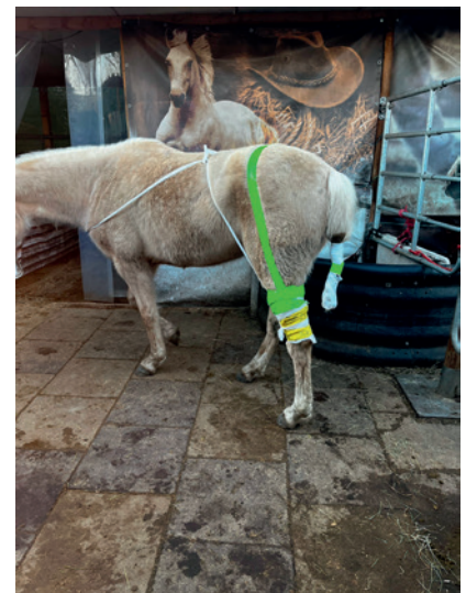
Abb. 6 : 07.02.2023 Ruby mit angelegtem und fixiertem Verband