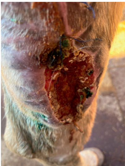
Abb. 4: Wundzustand am 07.02.2023