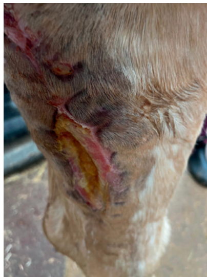
Abb. 11: 17.02.2023, vor der Wundreinigung