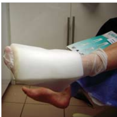
Zdj. 3: Widok z lewej strony. Materiały zastosowane: 1 szt. LIGASANO® białego 24 x 16 x 2cm, 1 szt. Opaski LIGASANO® białego, o szer.10cm. Fiksowanie - LIGAMED®