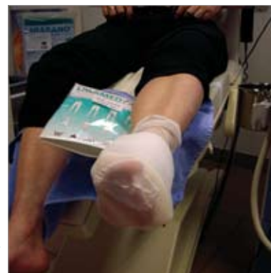
Zdj. 2: Opatrunek odciążający na lewej stopie, której 1 kość śródstopia wystaje mocno i sprawia problemy podczas chodzenia