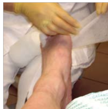
Zdj. 6: Najczęściej używam opaski o szer. 10 cm

Małe ranki w przestrzeniach międzypalcowych opatruję małymi kawałkami wyciętymi z LIGASANO® białego o gr.1 cm. Infekcje grzybicze w między palcami traktuję z zasady płynnymi antymykotykami, ponieważ kremy i maści stosowane w tych przestrzeniach zalepią pory skóry i pory opatrunku LIGASANO® białego.