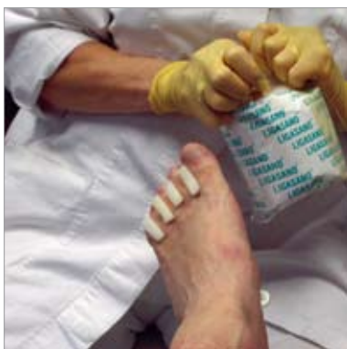
Zdj. 5: Dodatkowe zastosowanie opaski LIGASANO® białego w celu poprawienia lokalnego ukrwienia